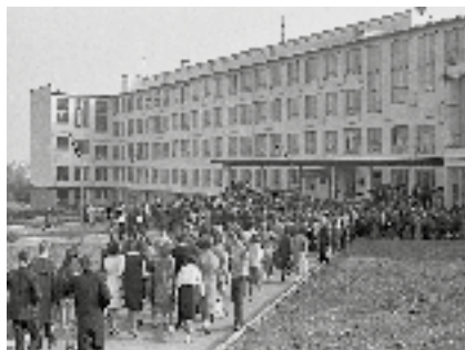
Создание нового университета

Р. И. Гельвигом. 13 октября 1920 г., после кончины Гельвига, ректором был избран академик В. И. Вернадский.